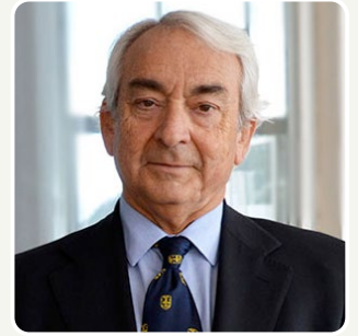
Dr. Antonio Coca

Editor y coeditor de 58 libros y monografías sobre hipertensión arterial, ha publicado más de 600 artículos en revistas con peer review y ha impartido más de 500 conferencias y ponencias invitadas en reuniones nacionales e internacionales.